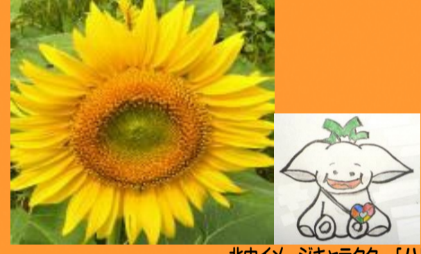
北中イメージキャラクター「ハピルン」

4ステージ制 1 s t : 出会いとマナー 2 n d : 仲間と団結 3 r d : 計画と実行 4 t h : 感謝と進路